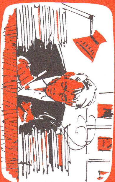
Viel zu sorgenvoll, um an Gott zu denken