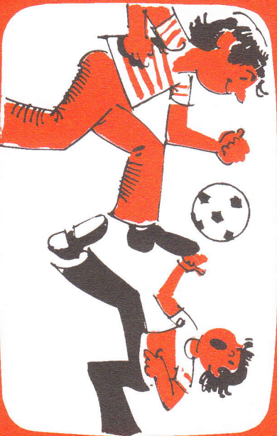
Viel zu übermütig, um an Gott zu denken