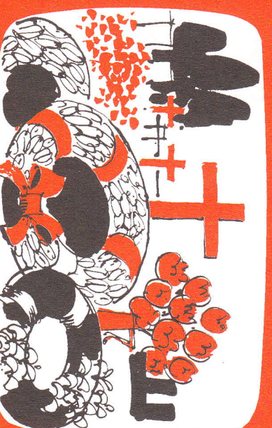
Viel zu spät, um an Gott zu denken