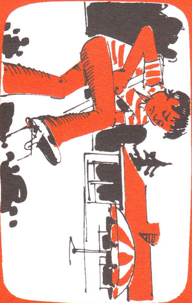
Viel zu beschäftigt, um an Gott zu denken