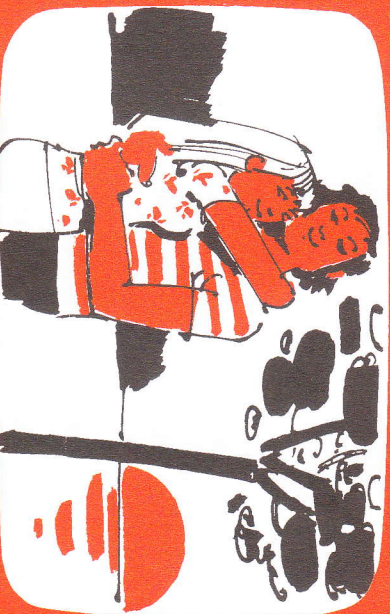
Viel zu verliebt, um an Gott zu denken