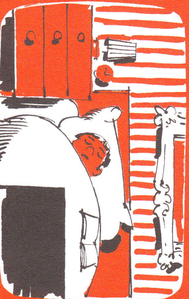
Viel zu müde, um an Gott zu denken